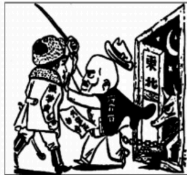
第 12 题图

12. 漫画常以其特有的艺术形式反映某一时期复杂的历史情形。上边图（右）是漫画家张仃于 1946 年完成的漫画作品，题为《十五年前的一幕童话》。这幕“童话”的上演，意味着